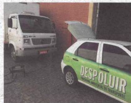
Telecargo Encomendas Expressas Ltda, em São José dos Pinhais