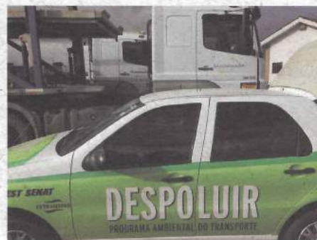
Transauto, em São José dos Pinhais