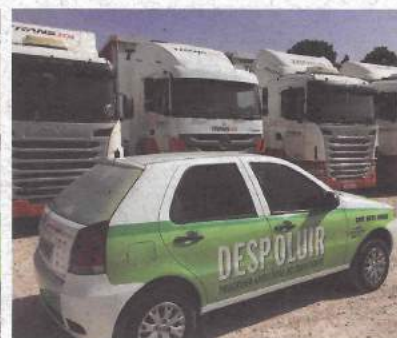
Transjot, em São José dos Pinhais