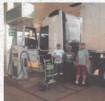
Cooperativa de Transportes (Coptrans), em Dois Vizinhos e Francisco Beltrão