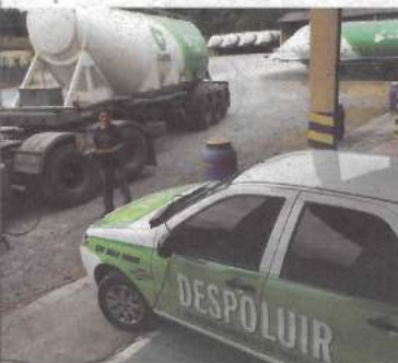
Itambé, em Balsa Nova