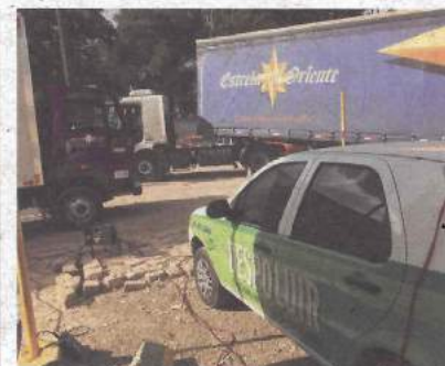
Estrela do Oriente, em Curitiba