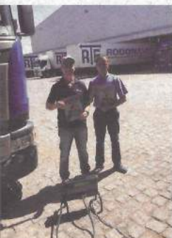
RTE Rodonaves, em São José dos Pinhais